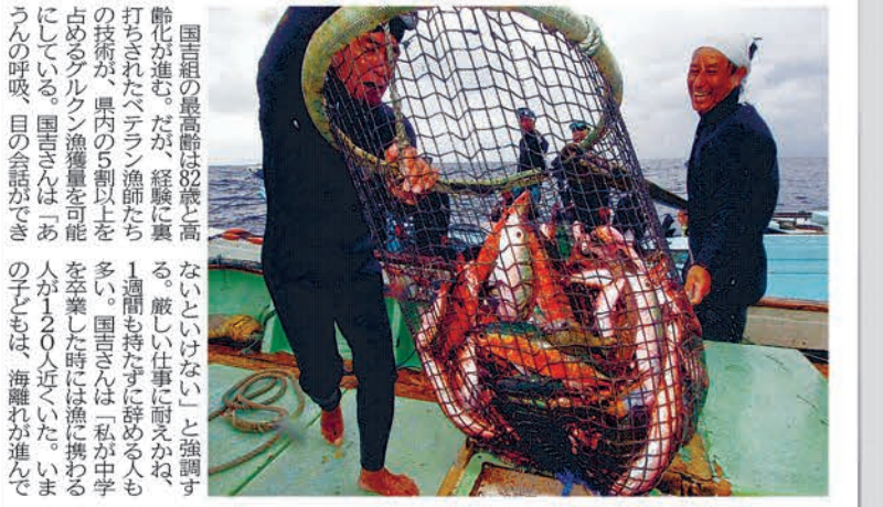
水揚げしたアギヤ漁をサバニカ

アギヤ漁に魅せられ 漁をこの目で見たいと、水中カメラを手に、興奮冷めやらぬまま伊良部島へと向かった。まだ夜が明けない午前5時、佐賀県佐賀市を離れ、水銀灯のオレンジ色の光の中、黒いウェットスーツに身を包んだ男たちが、一人また一人と姿を現す。真つ黒に焼けた顔の彼らは、無言で頭を下げ、目を押し出され、うん